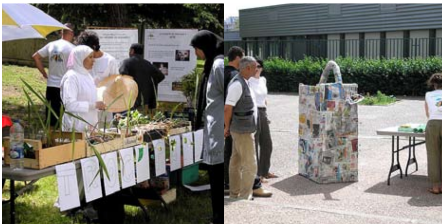
Des animations pour tous

La journée s'est déroulée sur 5 sites : D'Indy/Messenger, Satie, Alban Minville, Le Tintoret pour une clôture à Monlong (visite du parc, animations jardins partagés, goûter musical) via une navette mise à disposition des habitants.