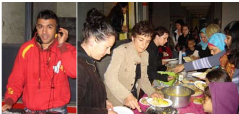
Musique et cuisine du monde à Grand d'Indy à Reynerie (243 logements) avec le soutien de Reynerie Service et de l'association « Bas d'immeuble »