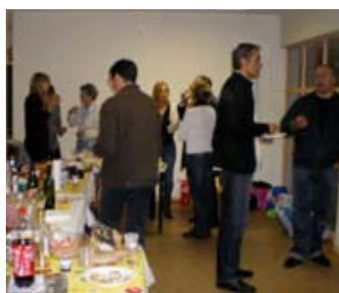
Une animation bien rodée par les locataires du Béarnais à l'Embouchure (86 logements)