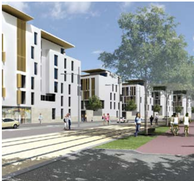
La Résidence Charles Lindbergh - Livraison 1 er semestre 2010

La ZAC Andromède accueillera à terme 3 700 logements près de l'usine d'assemblage de l'avion géant A380 d'Airbus. Sur 210 hectares situés sur les communes de Blagnac et Beauzelle, c'est un nouveau quartier de Blagnac qui comportera 20% de logements sociaux.