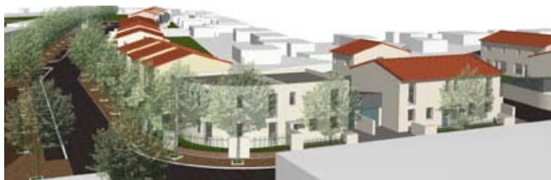
La construction en arrondi vient parfaire ce premier îlot.

Situé à proximité du centre ville (St Cyprien) et des berges de la Garonne, c'est un nouveau quartier qu'aménage l'OPAC Toulouse avec la construction, d'ici 2010, de 450 logements dont 277 logements sociaux labellisés Haute Qualité Environnementale*, sur une surface exceptionnelle de 7,5 hectares.