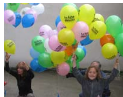
Lacher de ballons - Résidence Grande Bretagne à Purpan (81 logements)