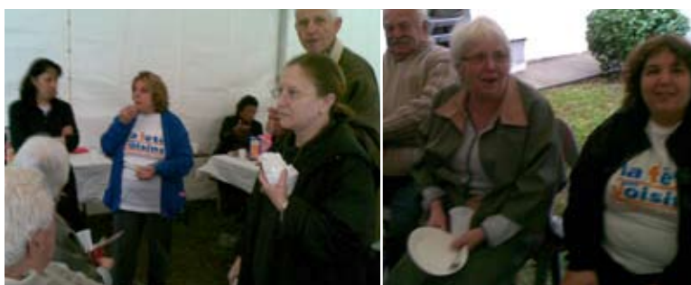
Rencontre sous chapiteau pour les résidents de Charles de Fitte à St Cyprien (56 logements)