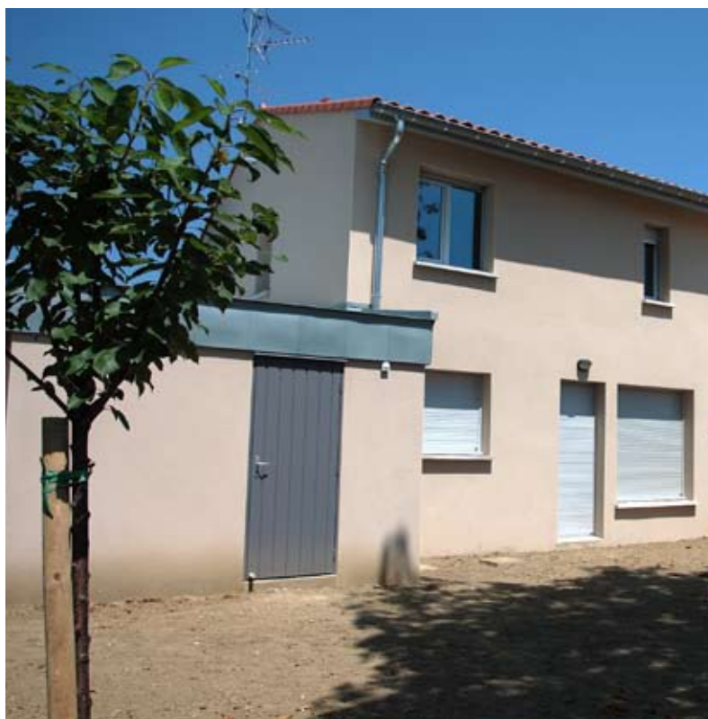
La toiture des garages est réalisée en zinc