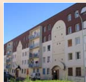
Infos travaux Tout en photos p. 6 et 7