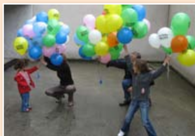
La fête des voisins en images p. 4