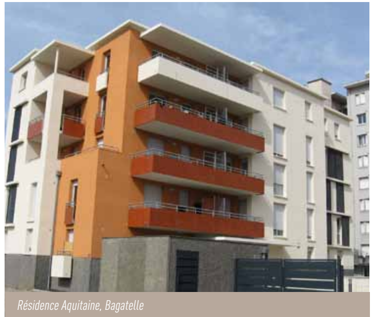
Résidence Aquitaine, Bagatelle

Livrée en février, Aquitaine est la troisième résidence neuve d'Habitat Toulouse réalisée dans le cadre du Grand Projet de Ville de Bagatelle/Faourette , après les résidences Falcucci (57 logements, mars 2008) et Le Clos de Saintonge (30 logements, décembre 2006). Située rue de la Charente, cette opération participe au renouveau du quartier de Bagatelle et témoigne d'une accélération du rythme des constructions neuves. La résidence comprend 3 bâtiments de 4 étages. Elle comporte 54 logements , du T2 au T5, avec balcons et terrasses en rez-de-chaussée, chauffage collectif au gaz, stationnement en sous-sol et aérien. Une charte de bon voisinage a été remise aux locataires afin de contribuer au « mieux vivre ensemble ». Le 3 juin, la résidence a été inaugurée en toute convivialité avec les locataires et l'équipe de proximité de l'agence Desbals en présence de Nicolas Tissot, Adjoint au Maire et de Stéphane Carassou, Président d'Habitat Toulouse.