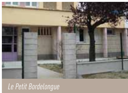
Le Petit Bordelongue