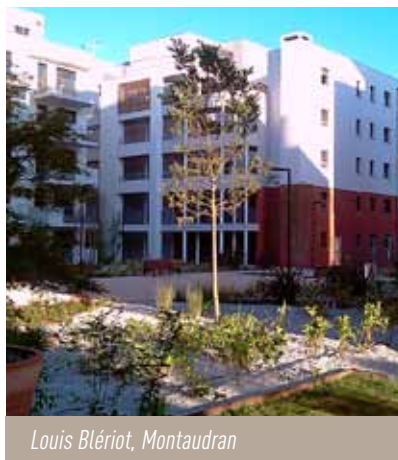
Louis Blériot, Montaudran

Fin mars, 21 logements ont été mis en location dans le cadre d'une VEFA auprès de Kaufman & Broad qui aménage la ZAC de Montaudran sur les anciennes pistes Air France.