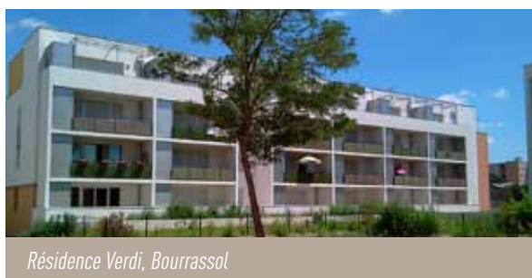
Résidence Verdi, Bourrassol

Du T1bis au T5, ces logements bénéficient d'une chaufferie collective (gaz de ville) et de la récupération des eaux de pluie pour l'arrosage des espaces verts ce qui permet une meilleure maîtrise des charges locatives .