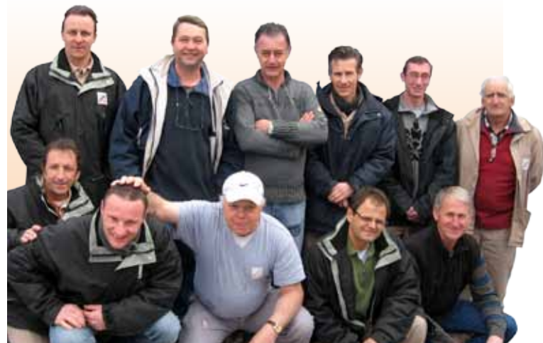
L'équipe de la régie d'ouvriers

A ce jour, la régie a accompli plus de 3 800 interventions . Elle est dotée d'un budget de 500 000 € pour l'année 2010.