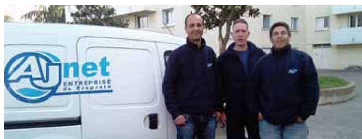
L'équipe de soutien logistique

Montant global de remplacement des ascenseurs financé par Habitat Toulouse : 1,642 M€