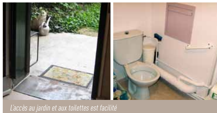
L'accès au jardin et aux toilettes est facilité

Les travaux ont démarré en fin d'année, sur une semaine, pour modifier le seuil entre la porte de la cuisine et la terrasse et faciliter l'accès au jardin. Les wc ont été déplacés et une porte coulissante a été posée pour un gain de place et d'utilisation. L'ensemble des volets roulants a été électrifié.