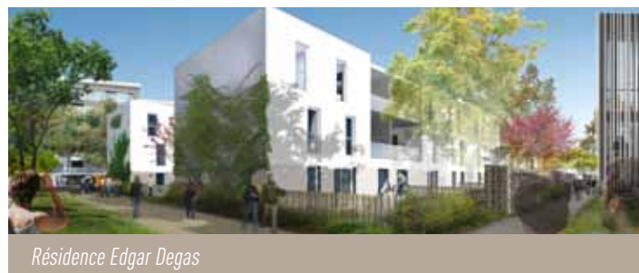
Résidence Edgar Degas

C'est un des projets phare d'Habitat Toulouse. Située dans le quartier Moulis-Croix Bénite, sur la nouvelle voie Virginia Woolf qui rejoint la route de Launaguet et le chemin des Izards, la résidence Edgar Degas comportera 174 logements .